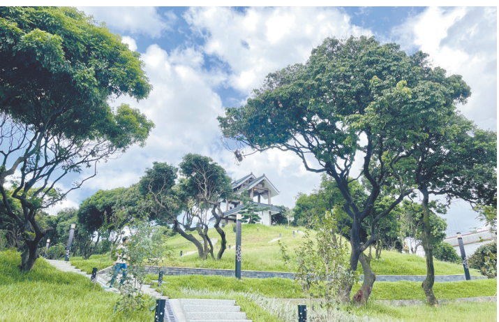
长安塘大岭皮荔枝公园

东坑讯 近日,东莞市全面推行林长制工作领导小组通报了全市32个镇街2022年度林长制工作考核结果,共有10个镇街获得“优秀”等次,其中,东坑镇榜上有名,获市级“优秀”等次。据悉,自全面推行林长制以来,东坑镇紧扣“林”这个主题,紧盯