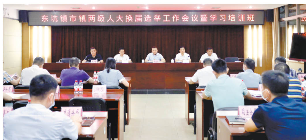
全力推进换届选举工作 圆满完成

会议要求,这次市镇两级人大换届选举工作关系重大,意义深远,时间紧、任务重、要求高,要在镇委的统一领导下,精准把握政策,精心组织,周密安排,确保圆满完成换届选举任务,为东坑镇建设“精致小镇、魅力东坑”提供有力保障。