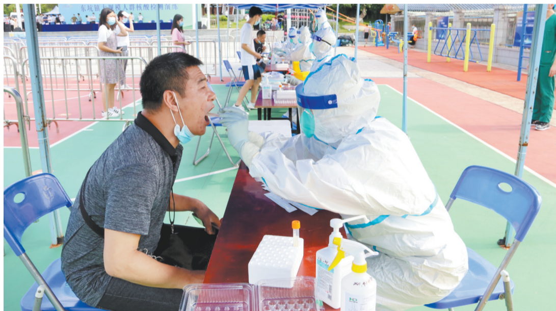
展大规模人群核酸检测演练。现场严格按照标准设置入口、等候区、测温区、信息登记区、采样区、临时医学观察点等区域,各区域配备足量工作人员,确保核酸采样快速有序进行。(周嘉英)