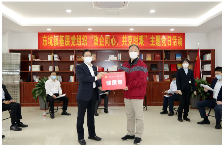
东坑镇基层党组织“政企同心、共克时艰”固定主题党日活动