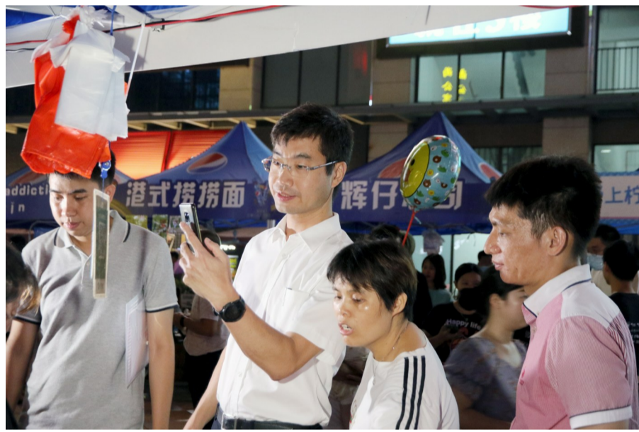
镇领导扫码购买,以实际行动鼓励青年摊主