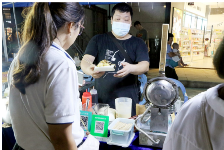
摊主现场制作美食