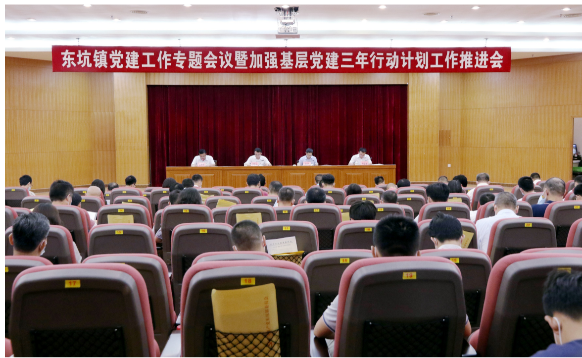
东坑镇党建工作专题会议暨加强基层党建三年行动计划工作推进会现场