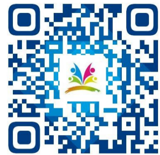
东坑镇青少年活动中心招聘专职教师报名表