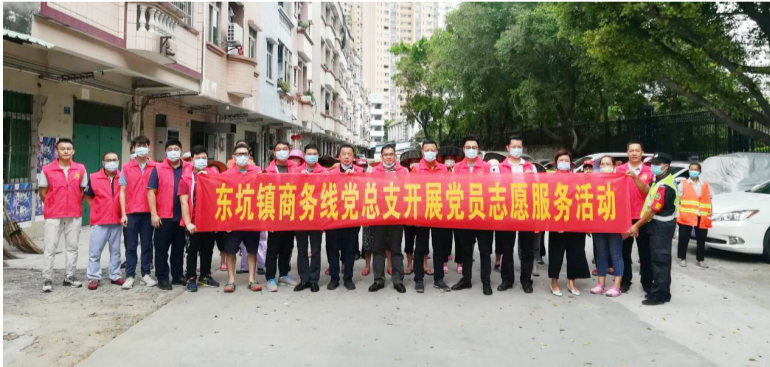
商务线党总支开展洁净城市清扫活动

作与日常业务工作有机结合,做到齐抓共进、常抓常新。一方面,将常规工作创新化。努力在党员日常管理、党员教育培训等基础党务工作上再出新成绩。另一方面,将创新工作常规化。从高点站位、创先争优常态化入手,强化“支部达标创优”“党员星级评定”和“基层党组织书记述职评议考核”的工作标准和目标导向,推动党员联户、支部联企、支部结对共建、网格化