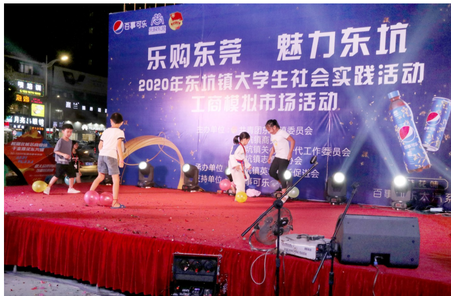
活动现场的互动游戏