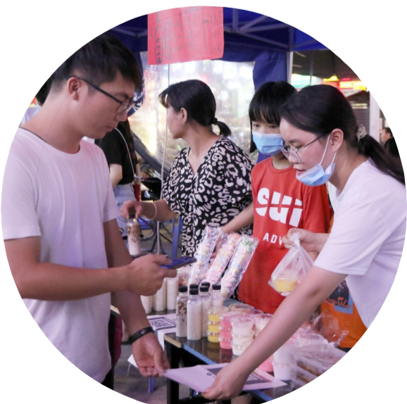
市民通过扫码支付购买商品