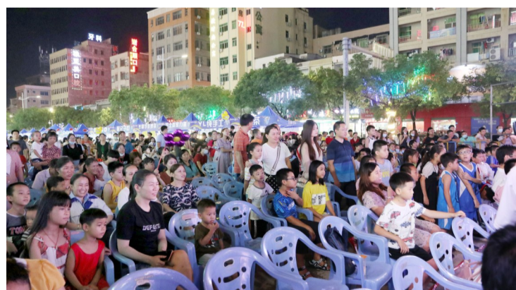
文艺演出吸引不少观众