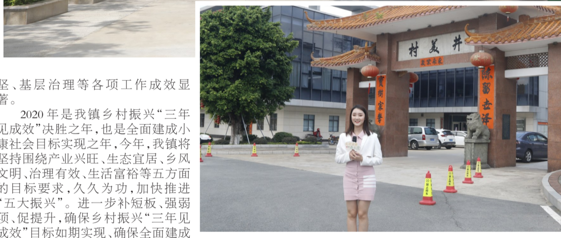
东莞广播电视台记者在井美村以直播的方式展示我镇乡村振兴建设成果