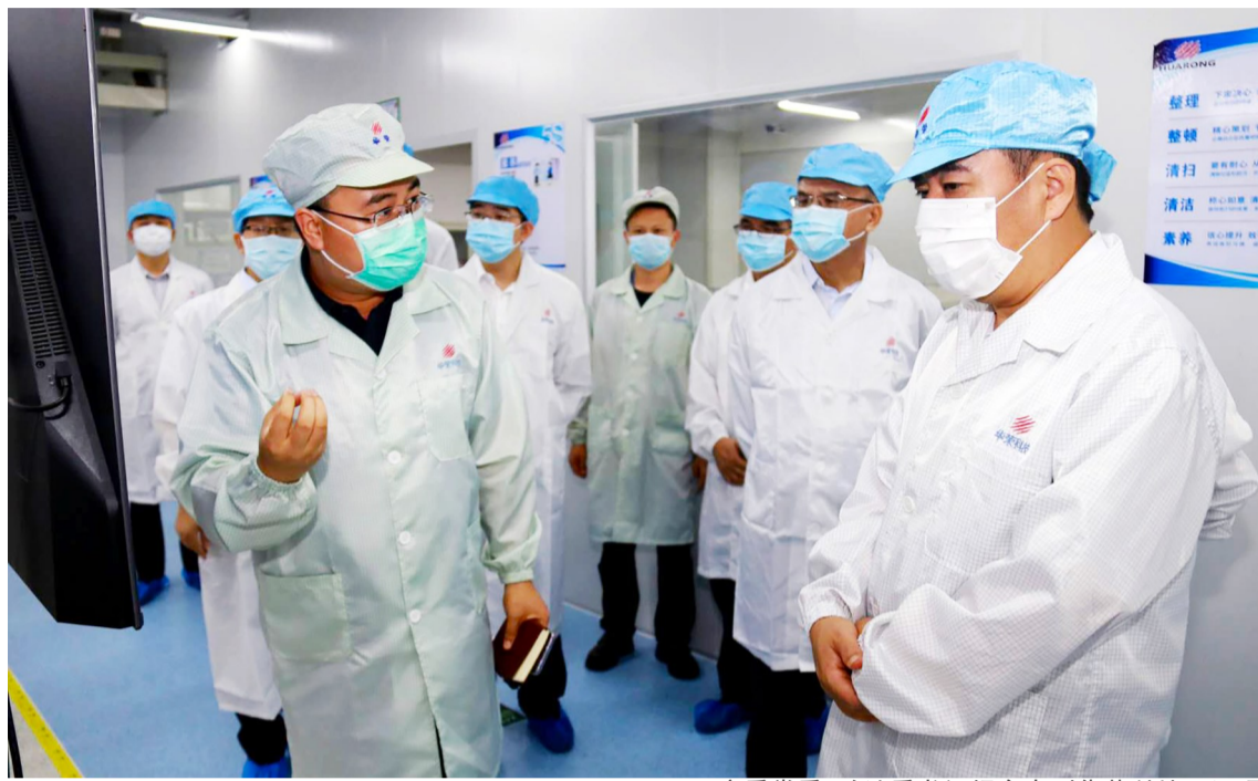
市委常委、政法委书记杨东来到华荣科技园调研

据了解,今年,我镇共有15个产业项目和2个基础设施工程项目纳入市重大项目,其中华荣科技、迅扬科技、优品精密、胜蓝科技等8个项目为重大建设项目,贵丰药业、日月辉电子、宝豪科技等9个项目为重大预备项目。1—7月份,8个重大建设项目完成投资6.7亿元,完成年度投资计划57%,完成年度目标任务的52.6%。