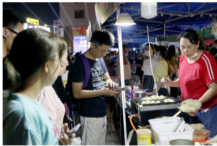
摊主现场制作美食