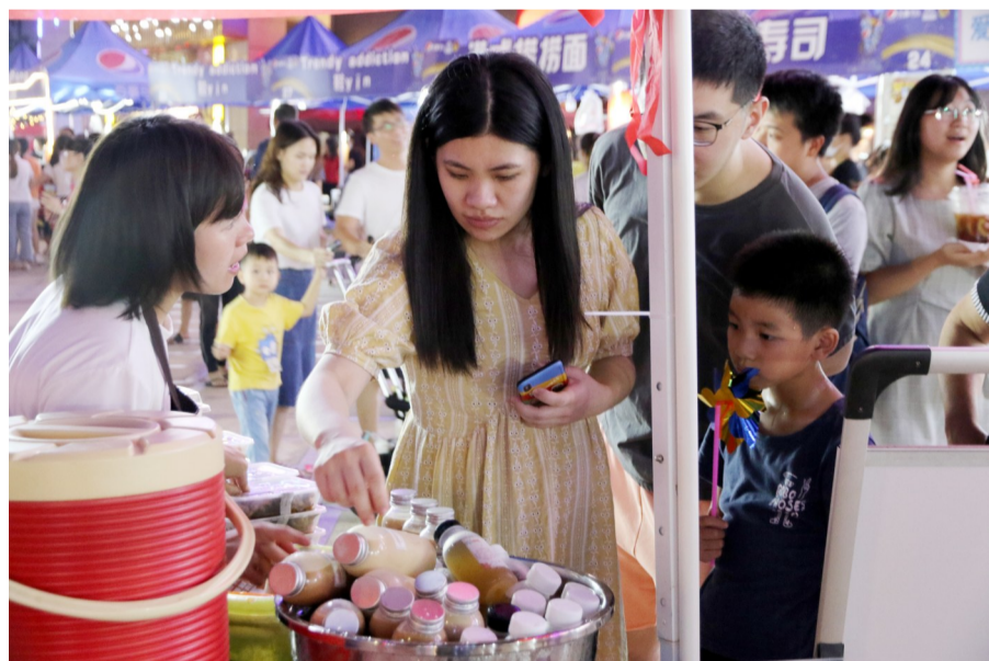
模拟市场商品琳琅满目