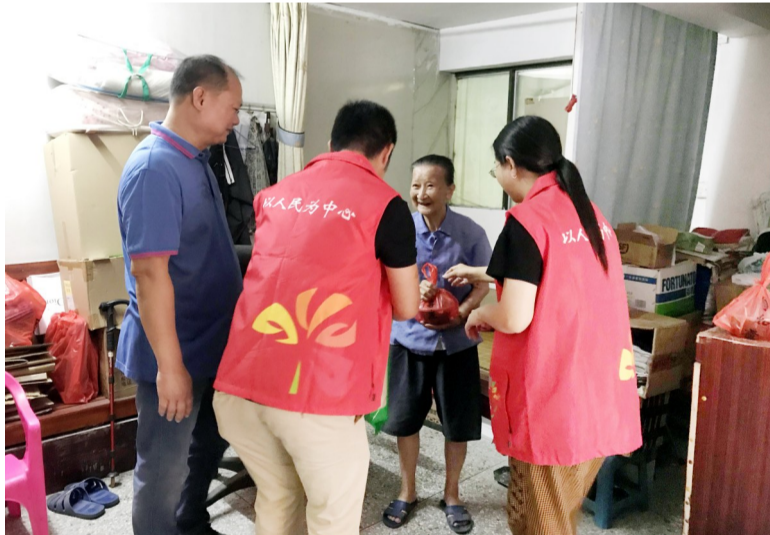
坑美村“关爱老人,夏日送糖水献爱心”志愿服务活动