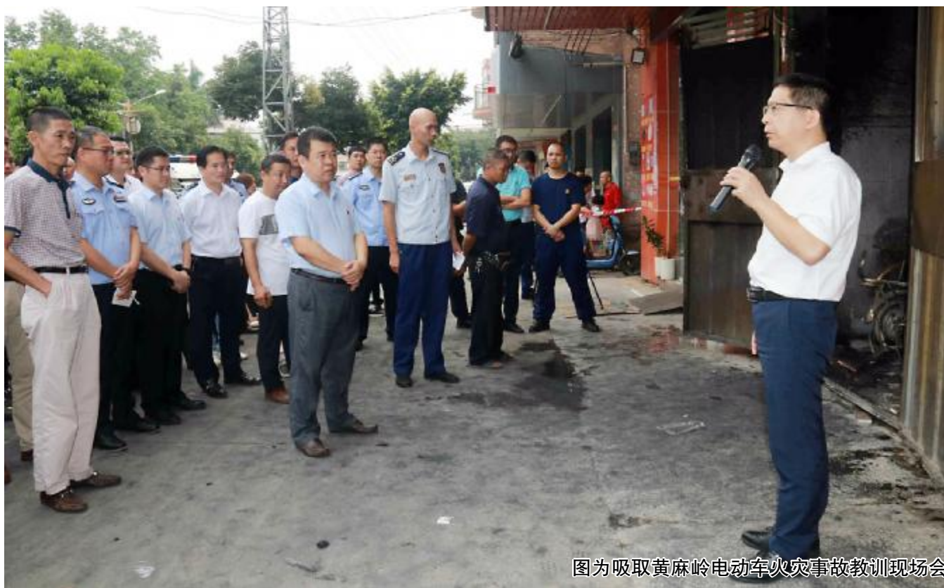
图为吸取黄麻岭电动车火灾事故教训现场会

此外,当天还召开了学生溺水问题隐患排查整治专项工作会议,会上要求各村(社区)、各有关部门要坚持“属地管理、分级负责”和“谁主管、谁负责”的原则,加强防溺水宣传教育、加大隐患排查力度,严防学生溺水事故发生。 (何学林)