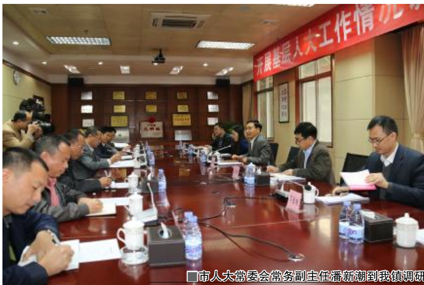
市人大常委会常务副主任潘新潮到我镇调研

潘新潮在听取汇报后,充分肯定了我镇过去一年人大工作取得的实效,尤其对我镇组织人大代表参与创文工作以及镇村统筹发展加快推进“三旧”改造工作等方面表示赞赏,认为我镇的经验值得借鉴推广,他也寄语我镇要继续强化人大代表培训,提升他们的综合素质,同时进