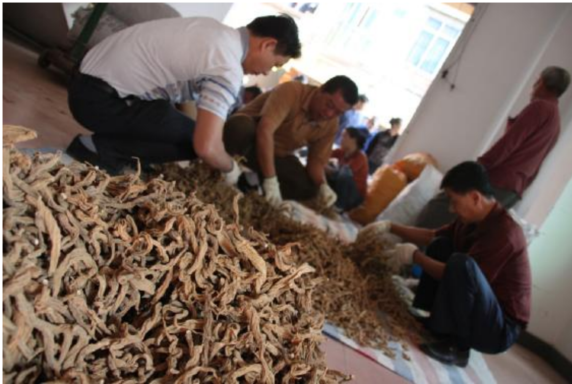
阴菜已经开始系统化生产和销售

据了解,一直以来,我镇党委政府都非常重视传统文化的传承和保护,为提高工作水平,在全市率先出台并实施了《东坑镇文物、非遗保护专项资金管理暂行办法》。目前,我镇的市级文物保护单位有丁氏祠堂、丁屋古围墙、彭氏大宗祠,市登记公布的不可移动文物有丁濂墓华表(将军柱)、井美文阁和21个镇级文物保护单位,以及省、市级非物质文化遗产“卖身节”、木鱼歌、阴菜、糖不甩和喊惊等,12项镇级非物质文化遗产保护项目等都列入管理范畴,实现了管理全覆盖。