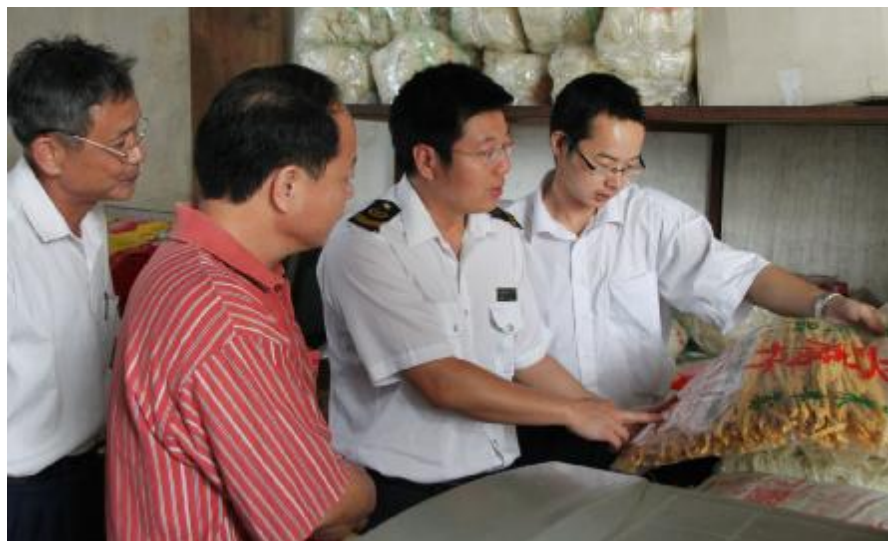
执法人员对学校的仓库进行检查