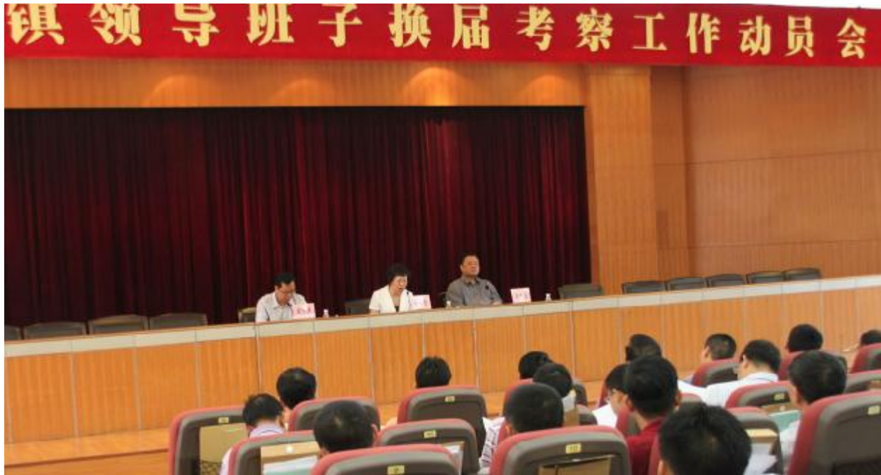
图为动员大会现场

镇领导班子换届考察组组长、市委组织部副部长喻丽君要求,广大党员干部要充分认识做好镇领导班子换届考察工作的重要意义,突出选好干部、配强班子。务必认真按照市委的要求,运用综合考评办法做好换届考察工作,严明换届选举纪律,为换届选举营造一个风清气正的环境。