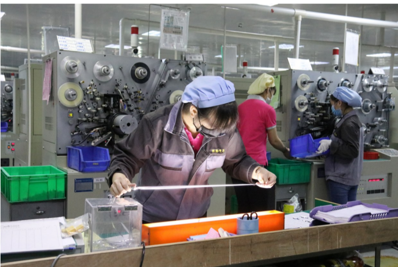
企业生产线开足马力,全力投入生产