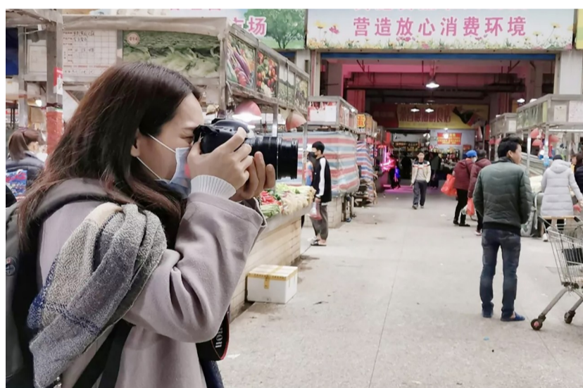
东坑新闻宣传战线的“娘子军”