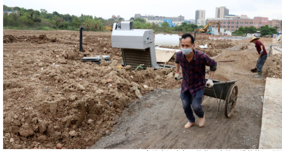
东坑内河应急一体化污水处理设施施工现场