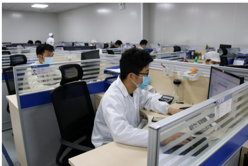
企业行政人员做足防疫措施,有序复工