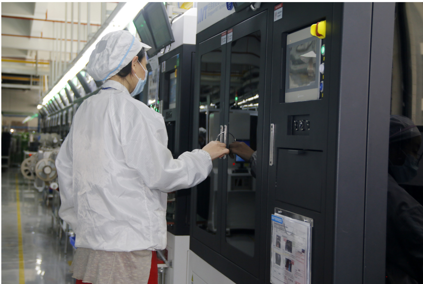
企业生产线开足马力,全力投入生产