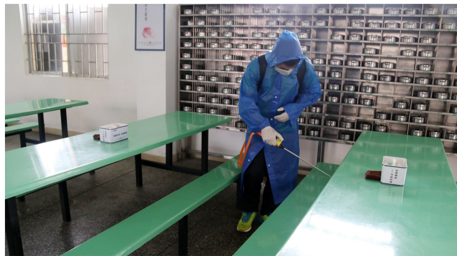
员工每天为工厂食堂全面消毒两遍以上