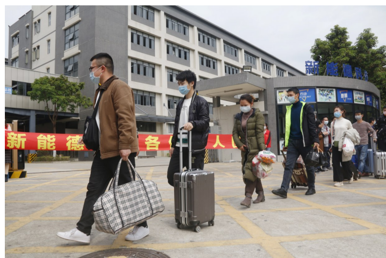
乘坐新能德首趟“返岗专车”员工顺利返岗