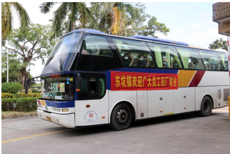
政企联合包车接员工返岗