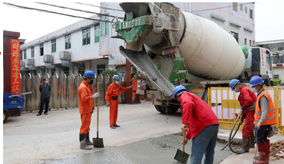
井美168工业区污水管网施工现场

自东莞发布“助企复工10条”,推出若干措施推动员工尽快返岗、企业早日复工以来,东坑政企联合持续、有序推进“点对点”外省专列返岗人员专车接送工作,有效解决企业用工难题。同时,各部门深入调研、做好服务,有力推进疫情防控,有序推进复工复产。据统计,截至3月8日,东坑镇复工企业2181家,复工率98.02%,员工返岗率92.5%;其中规上工业复工率97.57%,外资企业复工率91.2%,重点企业复工率100%。(文婷婷)