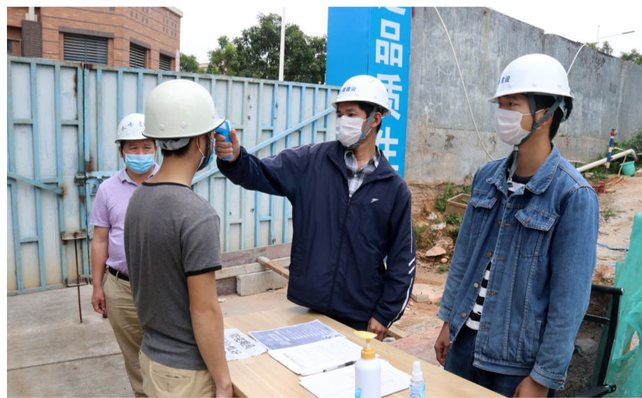
复工后的建筑工人每天要进行体温检测