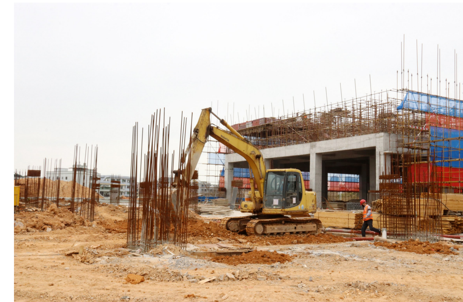
迅扬科技增资扩产项目施工现场