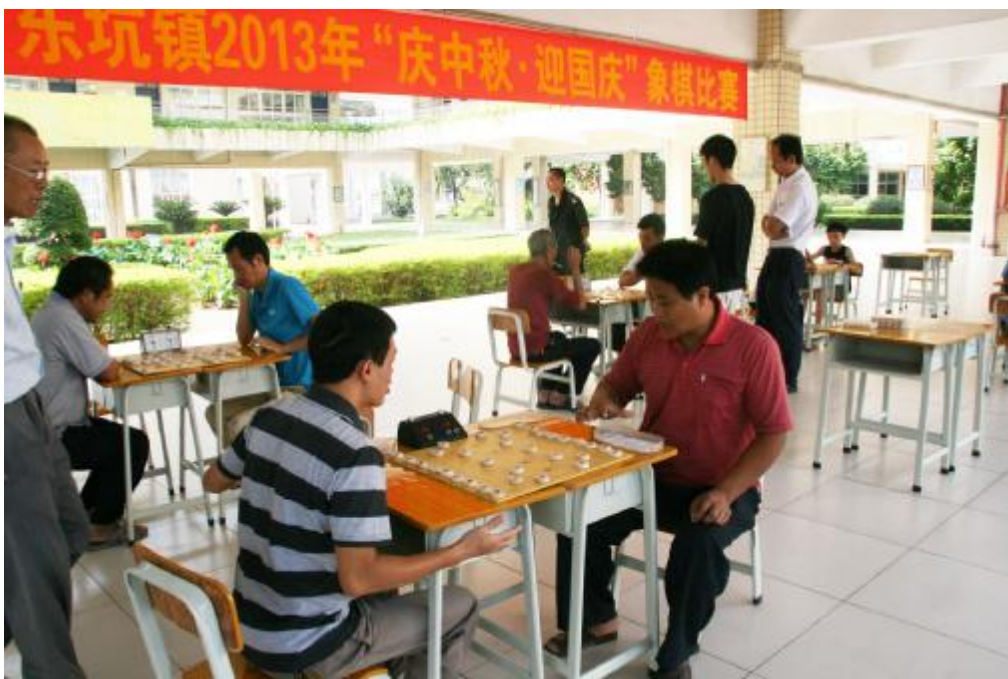
市民节日参与象棋比赛,文明健康过节

此外记者在公园、广场、农业园等地看到,不少市民都能自觉维护公共场所的环境卫生,做到垃圾、杂物不乱扔,各项秩序井然。“从自己做起吧,每个人出来自己的垃圾一定要放在垃圾桶里,如果离垃圾桶比较远的,自己拿个垃圾袋,到有垃圾桶的地方再扔进去就可以了。”一位在鹰岭公园游玩的新莞人如是对记者说。