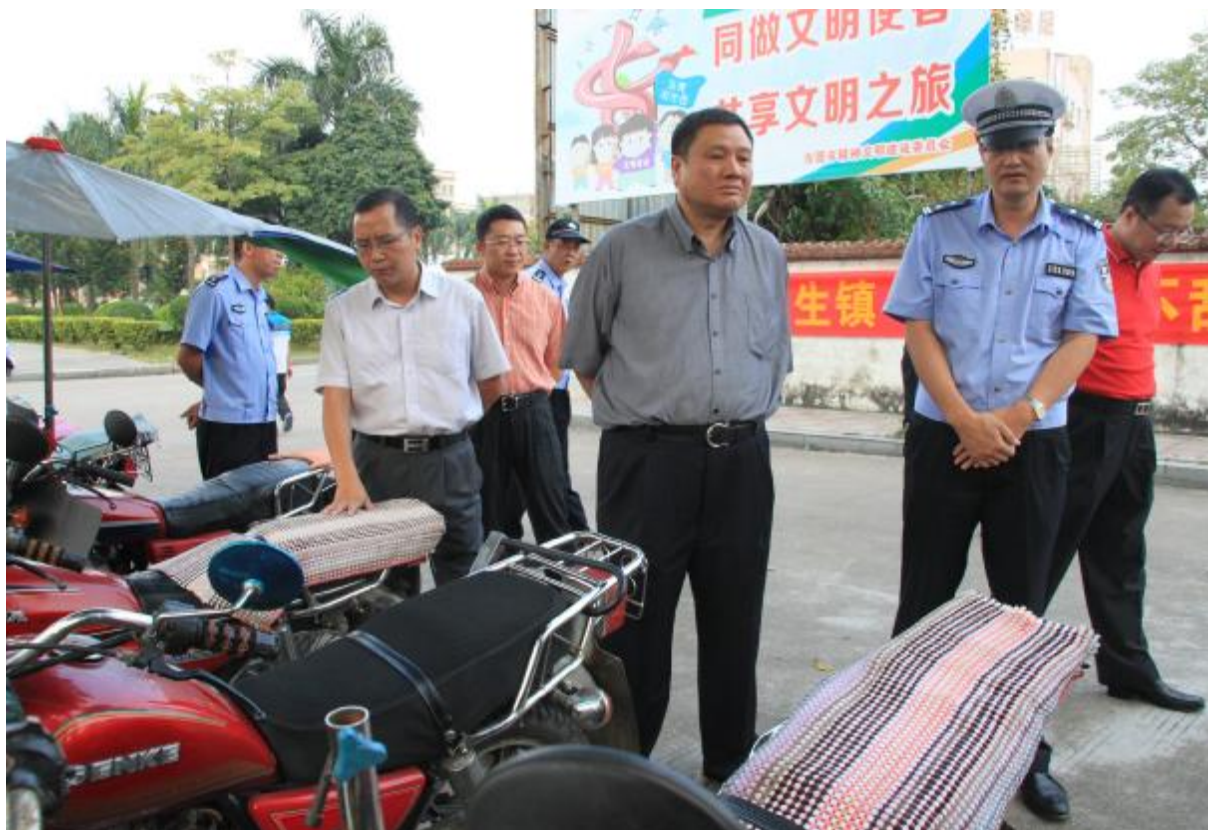
镇领导现场督导“治摩”工作