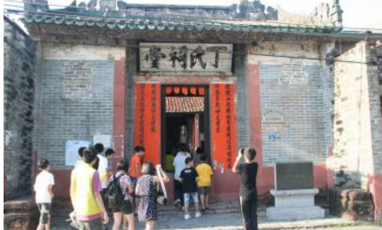
丁屋村组织中小学生游览丁屋古建筑,探索历史文化

参加活动的小朋友对古建筑和历史文化充满了兴趣都表示“通过这次的活能够对自己村的历史文化有了更深的认识,学会保护村里面的古建筑。”