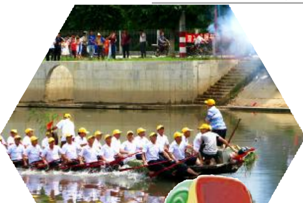
队员们一起喊着号子,一起发力划行