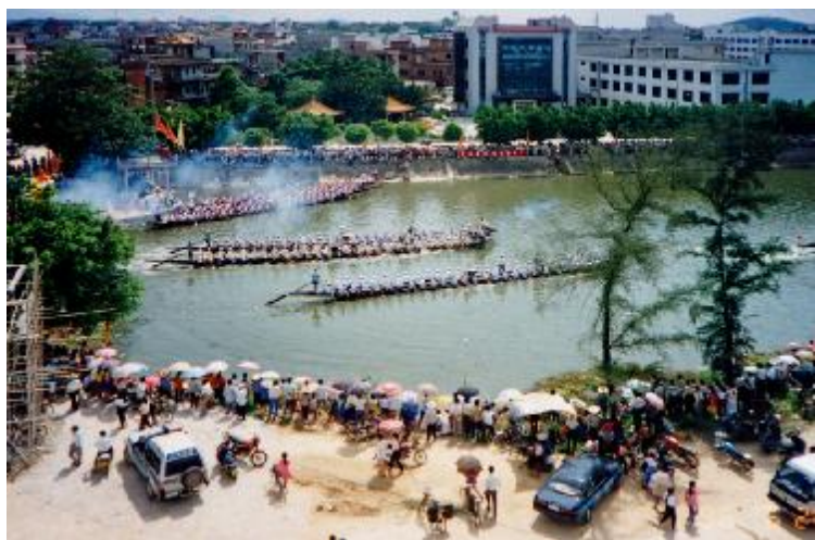
鞭炮响起,龙舟队开划

过端午节,是中国人二千多年来的传统习惯,由于地域广大,民族众多,加上许多故事传说,于是不仅产生了众多相异的节名,而且各地也有着不尽相同的习俗。其内容主要有:赛龙舟、吃粽子、女儿回娘家、挂钟馗像、悬挂菖蒲、艾草、游百病、佩香囊、给小孩涂雄黄、饮用雄黄酒等。