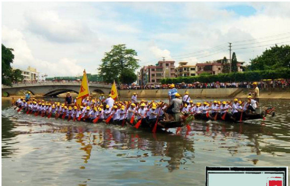
当年龙舟“趁景”盛况