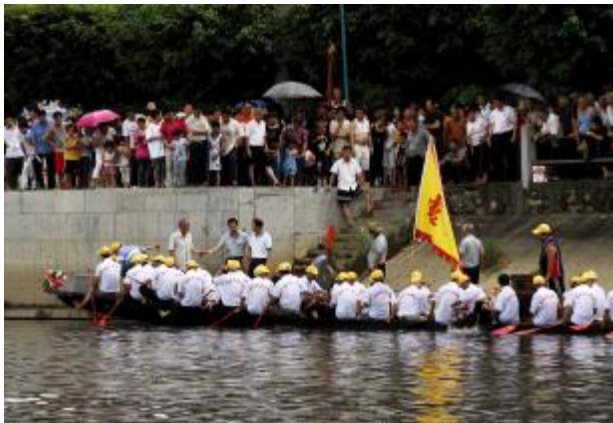
观看比赛的群众情绪高涨

自2008年起,端午节被列为国家法定节假日。2006年5月,国务院将其列入首批国家级非物质文化遗产名录;2009年9月,联合国教科文组织正式审议并批准中国端午节列入世界非物质文化遗产,成为中国首个入选世界非遗的节日。