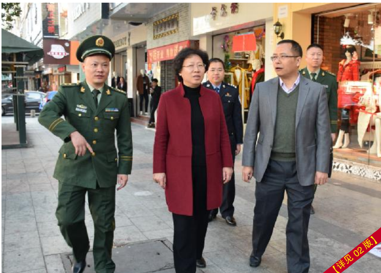
【详见 02 版】