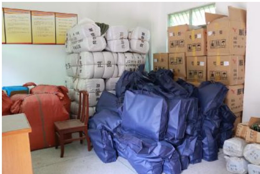
两名流浪人员同意接受救助,前往市救助站暂住,待市接送站联系家人后送回家。 (苏淑华)

此外,日前,东坑镇社会事务局还组织人员到各街道巡查,对流浪人员进行慰问和救助工作。巡查期间一共发现两名流浪人员,巡查人员为其送上食物以及保暖物品,经过沟通交流,最终