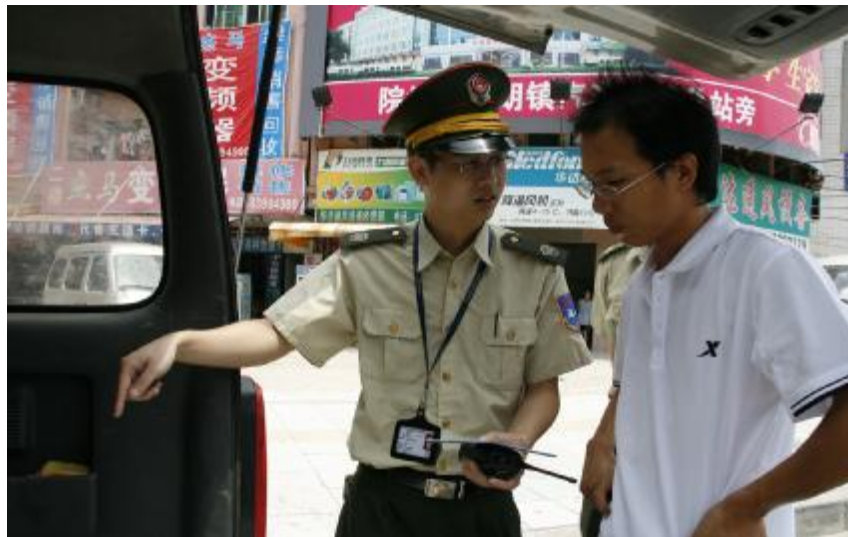
■ 我镇严查非法营运

镇交通运输分局相关负责人表示,我镇不仅在运输服务方面下功夫,在规范运输市场秩序方面也全