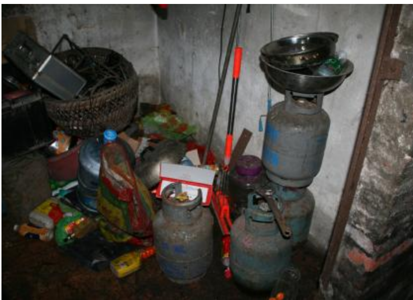
■屋内环境杂乱无章,存在很大安全隐患

据了解,今年3月份至今,我镇共检查燃气使用场所近200家,下发整改通知书80多张。“下来,我们会开展‘回头看’检查行动,检查发现存在问题的整改情况,确保消除燃气安全隐患。”检查组人员介绍道。