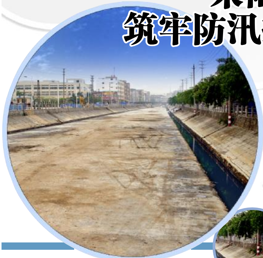
3·30 特大暴雨 水利设施发挥重要作用 全镇人民安全度汛

受低压槽和西南急流影响,3月30日,我镇降下大暴雨。据统计,30日8时至31日8时,东坑累计降雨达198毫米(期间30日15时至17时降雨102毫米,超过十年一遇,接近二十年一遇)。