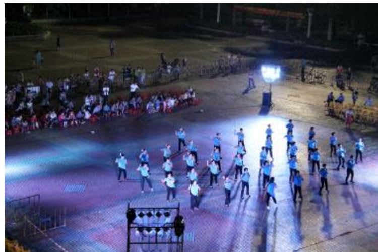
■台上和台下形成一道风景