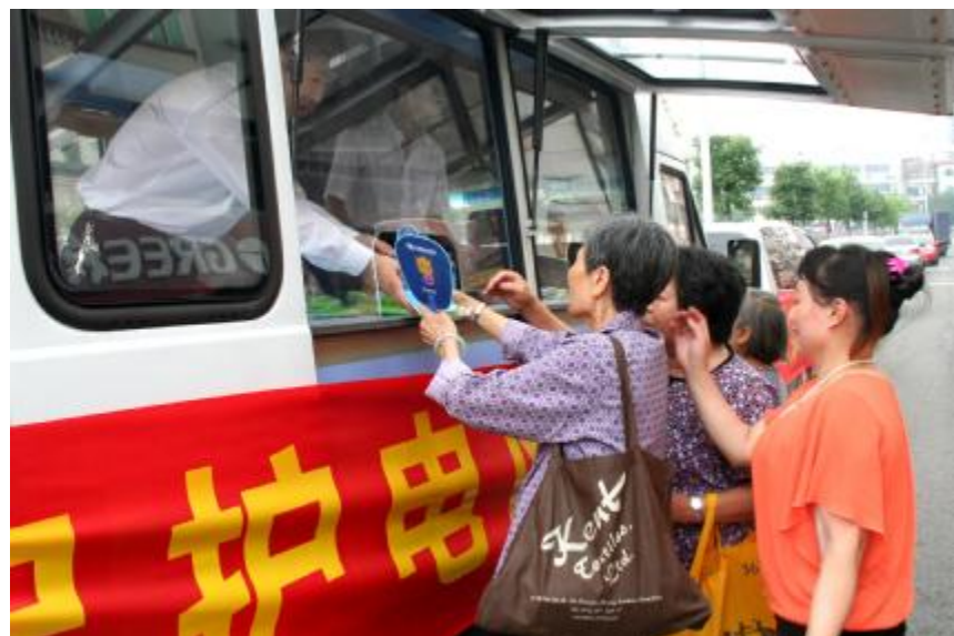
区,张贴宣传标语横幅等创新方式,深入做好保护电力系统的宣传工作。市民普遍反应活动效果明显,获益良多。