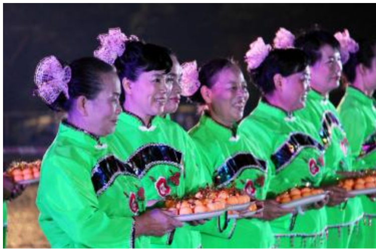
■东坑糖不甩搬上了大舞台