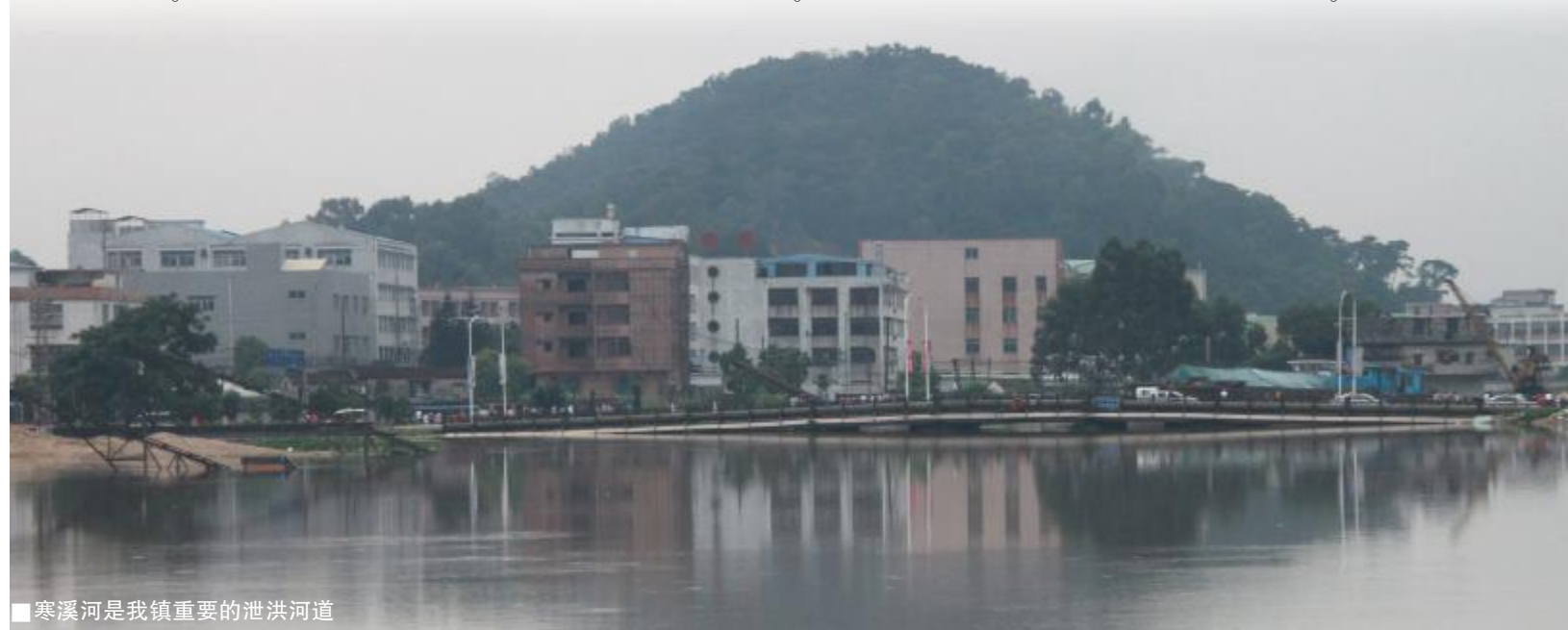
寒溪河是我镇重要的泄洪河道

“6.13”特大暴雨同村285.5毫米的降雨量，是雨，超50年一遇。这对投入的神山新排站提出东坑神山新排站联合，使东坑镇中心区的米/秒，远大于原来的28米/秒。