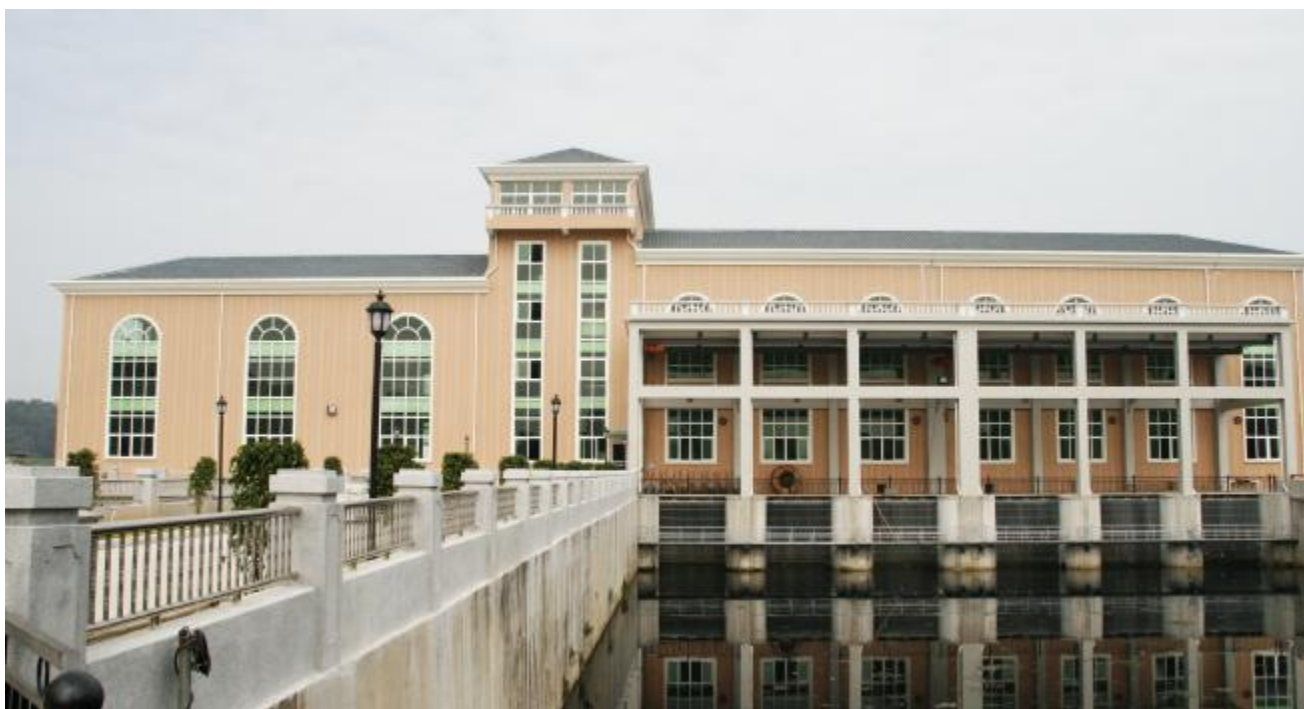
■神山新排站大大提高我镇排涝标准