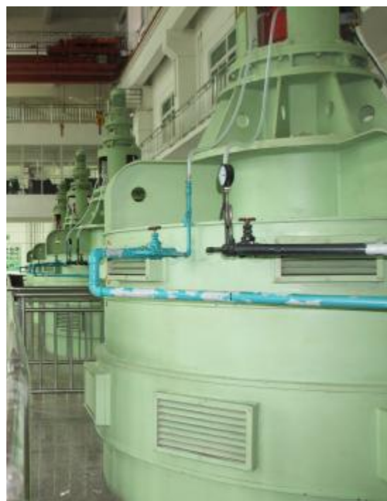
■神山排站装机6台均为管径1.6米的高压全调节直排泵