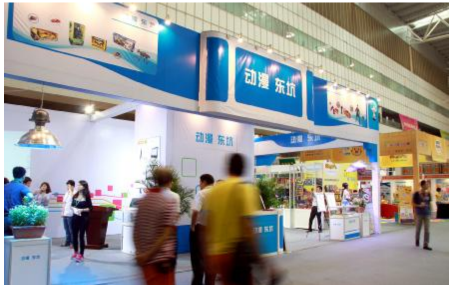
■我镇6个参展企业均带来了自家特色产品

而记者现场看到,我镇6个参展企业均带来了自家特色产品,如坚胜实业有限公司的GL系列植物生长无极灯和ELPL系列植物生长无极灯、小城故事手绘漫画制作公司的彩铅画、陶瓷作品等等。金禄电子科技有限公司职员更启动冬奥无纸化教学