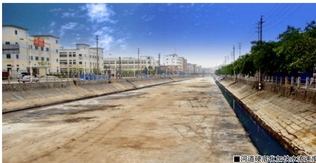
■河道硬底化加快水流速度

十分有限的情况下,东坑资2400万),正式开工启呈。随后,为解决新排站进再次自筹528万(市投资日排站,并扩宽扩深新排0米河段,建立了新排站。神山新排站建成,东坑的‘十年一遇24小时暴雨两十年一遇24小时暴雨一