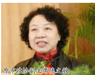
原市政协副主席陈文敏