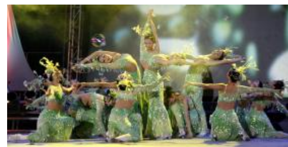
大型舞蹈《祝福东坑》