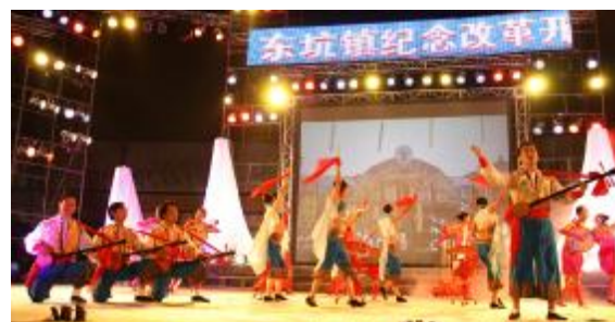
东坑特色《木鱼说唱卖身节》

2008年,我们刚刚走过了不平凡的一年,这一年我们遇到了前所未有的困难,这一年我们手拉着手坚强度过,面对着站在我们面前的崭新的2009年,我们既看到了挑战也看到了潜在的机遇,我们相信,只要我们依然手拉着手、心连着心,始终坚持镇委、镇政府的正确领导,就一定能走出更大的辉煌,信心2009,我们就能携手共创活力的新东坑。