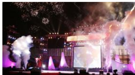
女声独唱《和谐中国》