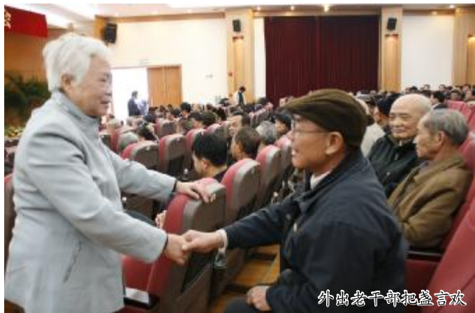
外出老干部把盏言欢