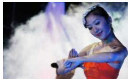
大型诗乐舞《和谐家园》

转眼一年过去,新年踏春而来,东坑大地繁花似锦、锣鼓欢腾,大街小巷到处都洋溢着节日的气息,盈满着春的温暖和节日的欢声笑语。春节是大家团圆的节日,亦是共享欢乐的节日。为此,1月13日晚,我镇在世纪广场隆重举行迎春文艺晚会,广大群众干部齐聚一堂,共享改革开放30年的丰硕成果。