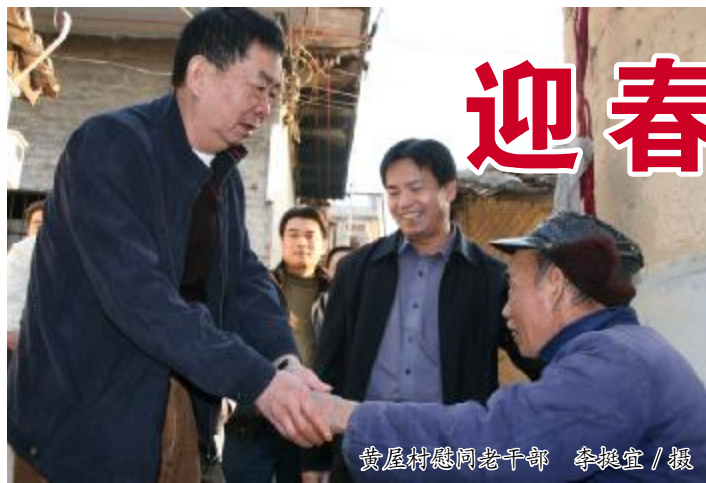
黄屋村慰问老干部