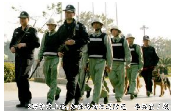
80%警力上路,加强路面巡逻防范

本报讯(记者李挺宜)为确保人民群众能过一个欢乐祥和的新春佳节,从1月16日至2月中旬,我镇在全镇范围内开展“雷霆”治安整治武装巡逻专项行动,进一步加强路面巡逻防范工作,全力维护我镇社会治安秩序。