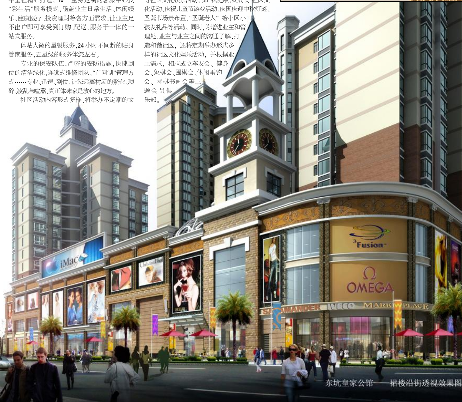
东坑皇家公馆——裙楼沿街透视效果图