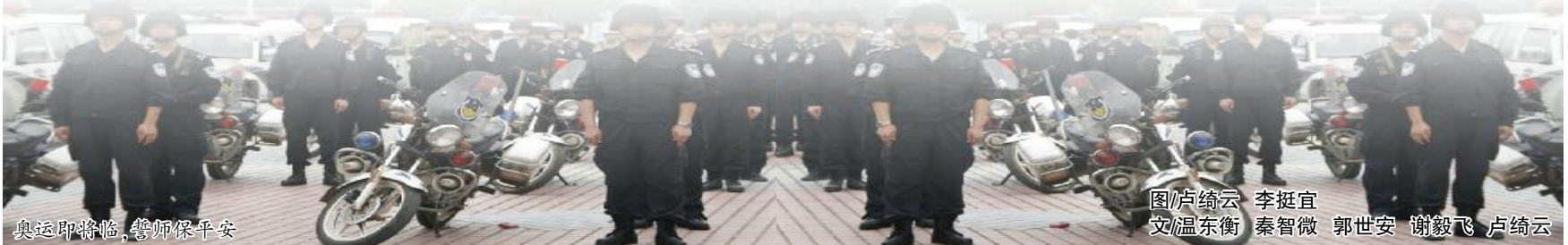
奥运即将临,誓师保平安

在安全检查过程中,尤其是加强乘客行包的“三品”检查,严禁乘客携带爆炸品、剧毒品、管制刀具、枪支等危险物品上车;同时加大力度开展车辆安全隐患排查,重点对车辆的电路、油路、发动机等装置进行全面检查,并详细掌握灭火器、安全锤等应急设备的配备情况;制定并完善各种突发性安全事件的应急预案,从各个环节营造安全有序的司乘环境。