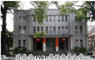
建成于1961年的井美会堂

岁月中,井美古庙、祠堂等有几十间,如今已经荡然无存。明、清两代,是井美的鼎盛时期,人文蔚起,科甲连发。根据《东莞县志》记载,井美村先后有3人考取进士举人。其中,谢良翰,字周楨,号崧台,明隆庆四年(1570年)中乡试52名举人,官至直隶太平府繁昌县知县,整顿治安,肃清恶俗,使该县繁荣昌盛,深受爱戴,其事迹康熙年间入载《广东通志》,可见有功于世,政绩斐然。清朝乾隆年间,乙卯年谢文苑中举人,