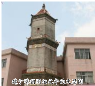
建于清朝同治元年的文昌阁