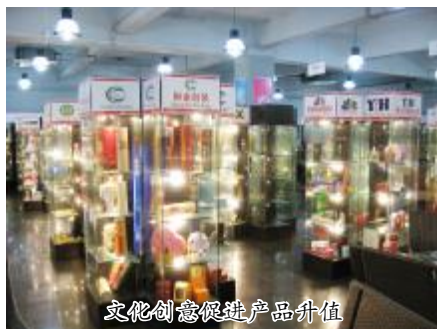
文化创意促进产品升值

综上所述,创意产业是以人的创造力、想象力为核心,在其他产业的基础上,在生产和服务中融入创新元素、文化元素,应用科技、市场和制度手段,为社会创造财富并提供广泛就业的超级产业。从本质而言,创意产业的兴起是当今世界经济、文化、社会中各种要素关系重大演变的结果,是对传统产业逻辑的颠覆,是产业进化的产物,将开创产业革命的新纪元。