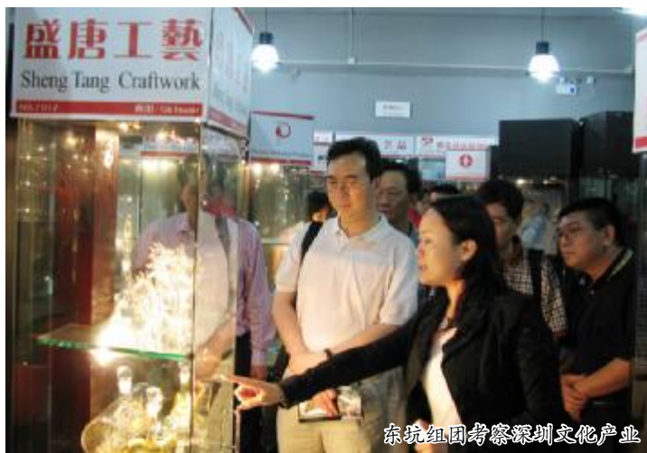
东坑组团考察深圳文化产业

面对这个呼啸而至的创意时代,短短半年时间,东莞的创意产业从萌芽到席卷全市,发展的速度令人惊喜。目前东莞已经确立创意产业的战略,立足全球大环境中求发展,改造提升传统产业,发展新产业,将对提升城市综合竞争力具有重要的作用。今年春季,我市莞城联丰工业园区正式被市经贸局批准为“东莞市创意产业中心园区”,成为东莞首个创意产业园区。这是莞城区在去年参观学习上海、南京市创意产业园区的基础上启动的试点园区,明确提出了