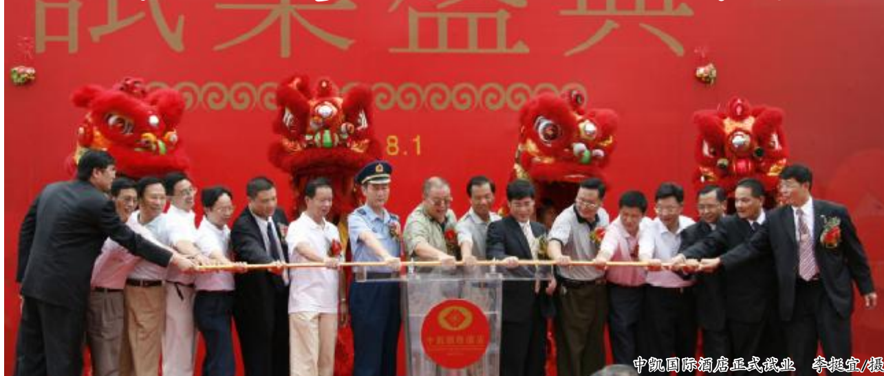
中凯国际酒店正式试业

本报讯(记者 秦智微 丘君花)我镇首家按五星级标准建设的中凯国际酒店于8月1日举行试业盛典,该酒店的试业将进一步促进我镇第三产业蓬勃发展,为我镇“商贸工程”注入新的亮点与活力,大力推进了我镇的城市升级。