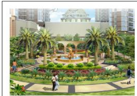
爱丽丝花园效果图