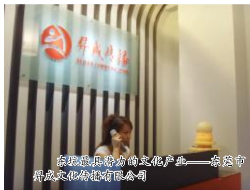
东坑最具潜力的文化产业——东莞市羿成文化传播有限公司

创意产业是经济结构转型的支撑点,发展东坑创意产业任重道远,必将不断推动产业升级,进一步转变经济的增长方式,实现东坑新的历史大跨越。